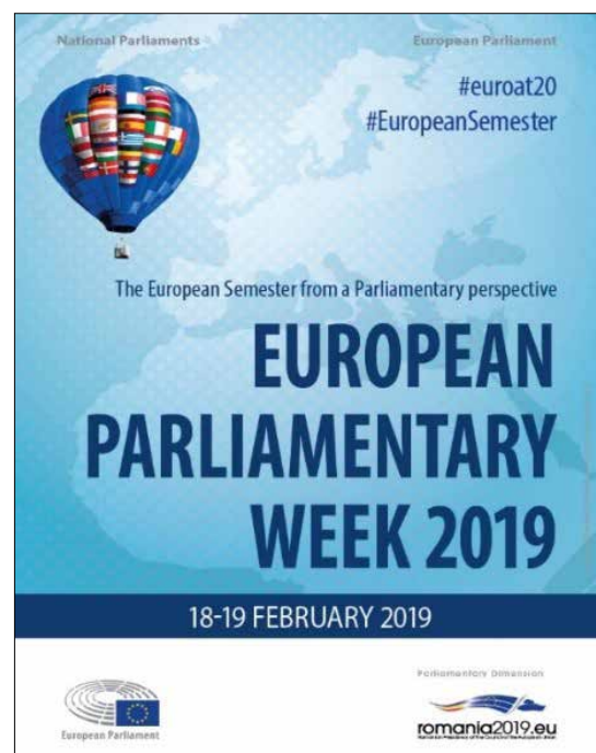
Плакат за Европейската парламентарна седмица, 2019 г.

Всички дебати допринесоха за събирането на членовете на националните парламенти в ЕС и на Европейския парламент с цел по-тясно сътрудничество по въпроси, свързани с европейския семестър.