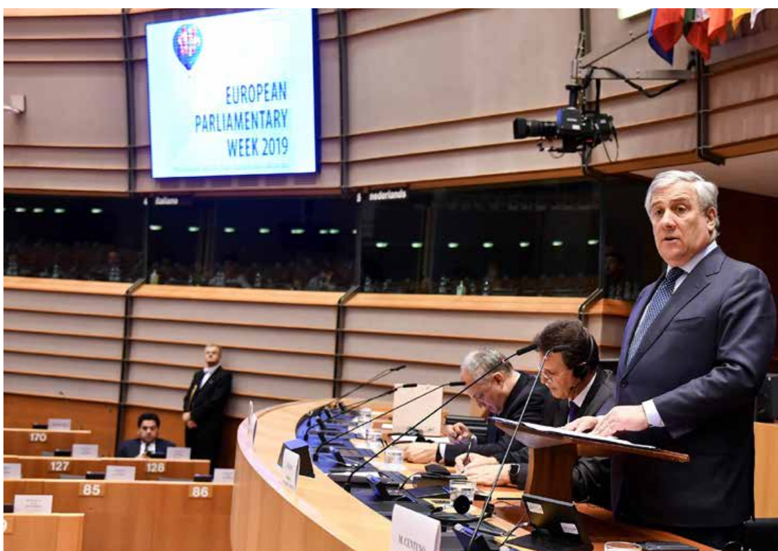
Председателят на ЕП Антонио Таяни говори на конференцията за европейския семестър в Брюксел на 19 февруари 2019 г.

Освен изказалите се от националните парламенти в ЕС, Европейския парламент и институциите на ЕС, за дебата допринесоха и оратори от академичните среди и от частния сектор. И четирите дебата отразяваха силния интерес на националните парламенти и на Европейския парламент по тези теми.