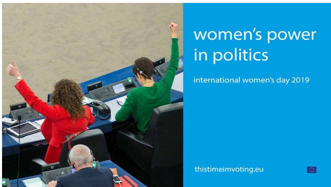
Междупарламентарно заседание на комисии по повод на Международния ден на жената през 2019 г. ©EU-EP.

По повод на Международния ден на жената през 2019 г. комисията по правата на жените и равенството между половете (FEMM), заедно с отдел „Законодателен диалог“ на Дирекцията за връзки с националните парламенти, покани членовете на националните парламенти на държавите — членки на ЕС да участват в междупарламентарно заседание на комисии, посветено на властта на жените в политиката.