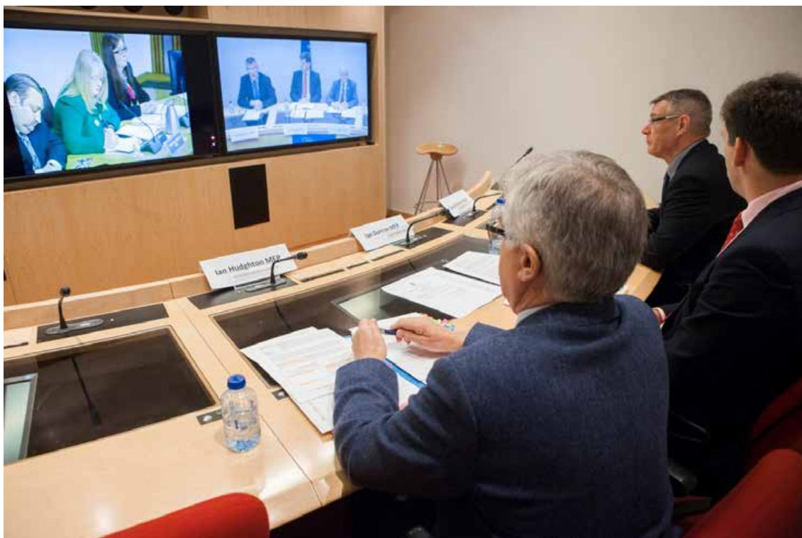
Видеоконферентни връзки в Европейския парламент.

Видеоконферентните връзки откриват нови възможности и могат да улеснят междупарламентарното сътрудничество. Европейският парламент може да предостави техническо решение, което дава възможност за видеоконференции с отлично качество на изображението и звука и устен превод на няколко езика. Използването на видеоконферентна връзка може да допринесе за по-редовен контакт между парламентаристите и може да доведе до намаляване на времето за пътуване и разходите за командировки, и освен това тази практика е екологосъобразна. Като цяло тази връзка представлява икономически ефективен инструмент за организиране на срещи.