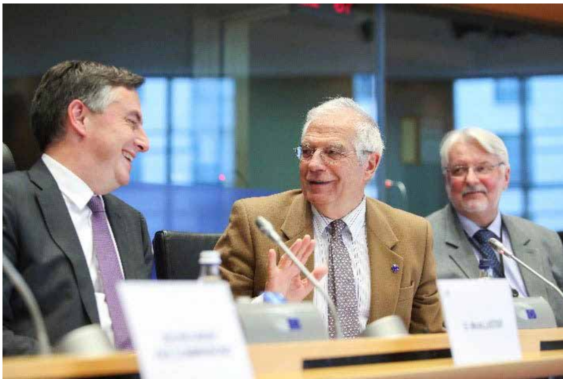
Г-н Дейвид Макалистър, председател на комисията AFET, г-н Жозеп Борел, ЗП/ВП и г-н Витолд Ян Вашчиховски, заместник-председател на комисията AFET, на междупарламентарното заседание на комисии, организирано съвместно от Отдела за законодателен диалог и от комисията по външни работи на 4 декември 2019 г.

На 24 септември 2019 г. комисията по икономически и парични въпроси (ECON) покани националните парламенти на държавите — членки на ЕС да участват в междупарламентарно заседание на комисии за обсъждане на специфичните за всяка държава препоръки. Акцентът в обсъжданията беше поставен върху изпълнението на приоритетите на европейския семестър за 2019 г., както и върху приоритетите за годишния обзор на растежа за 2020 г., което ще бъде основата за европейския семестър за следващата година.