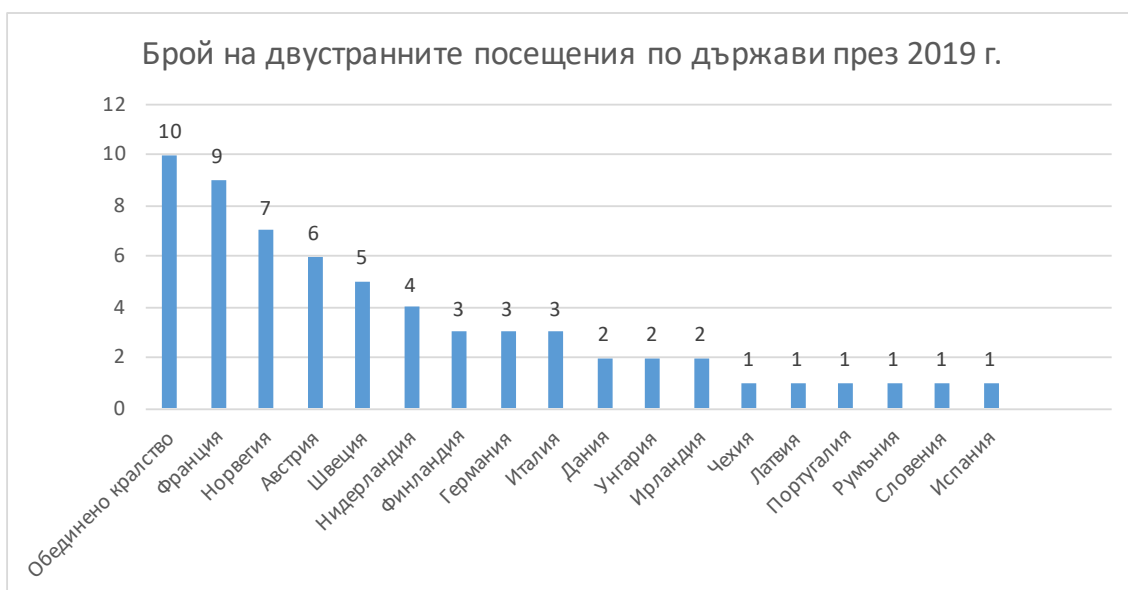
Брой на двустранните посещения по държави през 2019 г.

Преговорите за Брексит определено повлияха върху темите и честотата на двустранните посещения от страна на Парламента на Обединеното кралство през 2019 г.