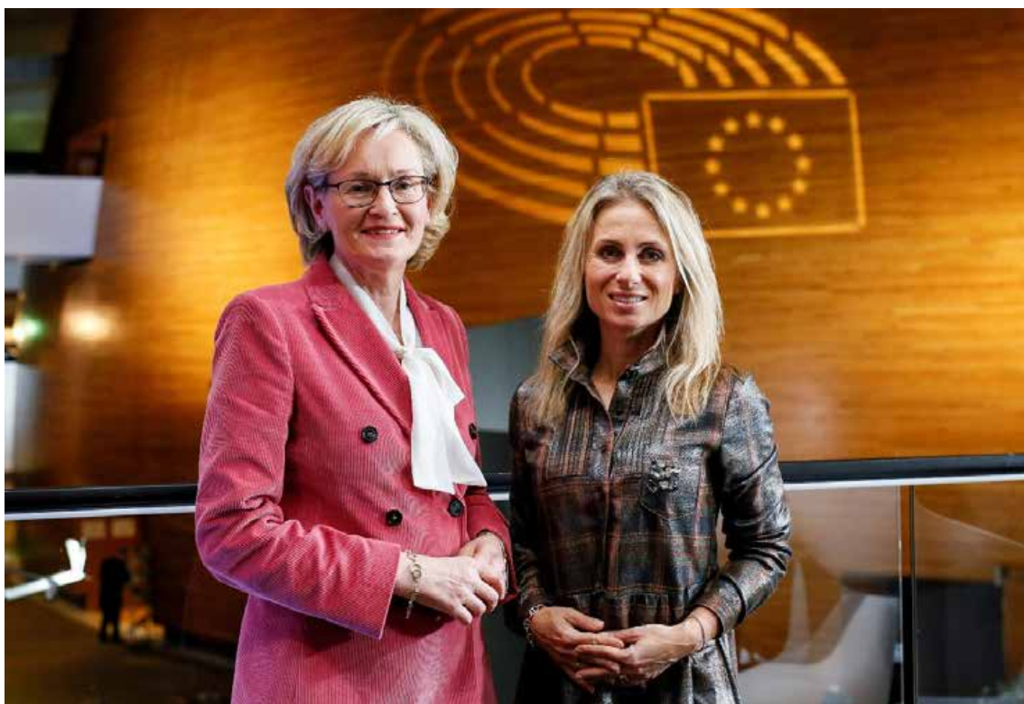
Марейд Макгинес Първи заместник-председател