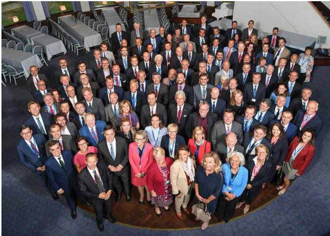
Междупарламентарна конференция по въпросите на общата външна политика и политика на сигурност и общата политика за сигурност и отбрана (МПК ОВППС/ОПСО) в Хелзинки, 4 – 6 септември 2019 г.

Те подкрепиха също идеята, че сътрудничеството на ЕС в областта на отбраната следва да продължи да се координира с НАТО. Те приветстваха предложенията на председателя на Комисията Урсула фон дер Лайен за увеличаване на финансирането на външната дейност в новата МФР за периода 2021—2027 г.