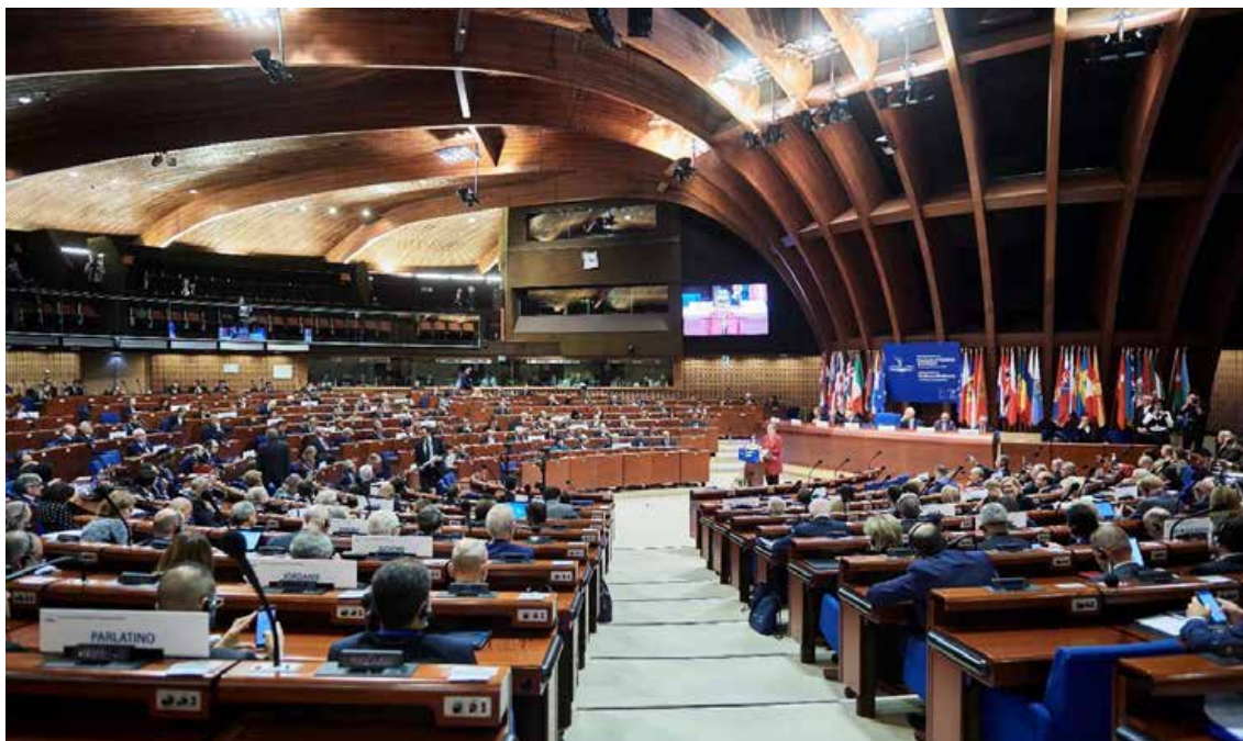
Встъпително слово на г-жа Лилиан Маури Паскуе на Европейската конференция на председателите на парламенти в Страсбург на 24 октомври 2019 г.

На 24 и 25 октомври 2019 г. в Страсбург се проведе Европейската конференция на председателите на парламенти, организирана от Парламентарната асамблея на Съвета на Европа (ПАСЕ). Съветът на Европа беше домакин на около 60 председатели заедно с 300 други делегати от държавите — членки на Съвета на Европа и от държави партньори, както и от други международни асамблеи. Европейският парламент беше представяван от г-жа Дита Харанзова, първи заместник-председател на ЕП.