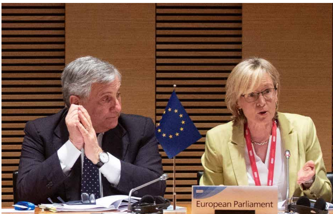
Г-н Антонио Таяни, председател на комисията по конституционни въпроси, и г-жа Марейд Макгинес, първи заместник-председател на Европейския парламент, на заседанието на председателите на КОСАК в Хелзинки, 21—22 юли 2019 г.