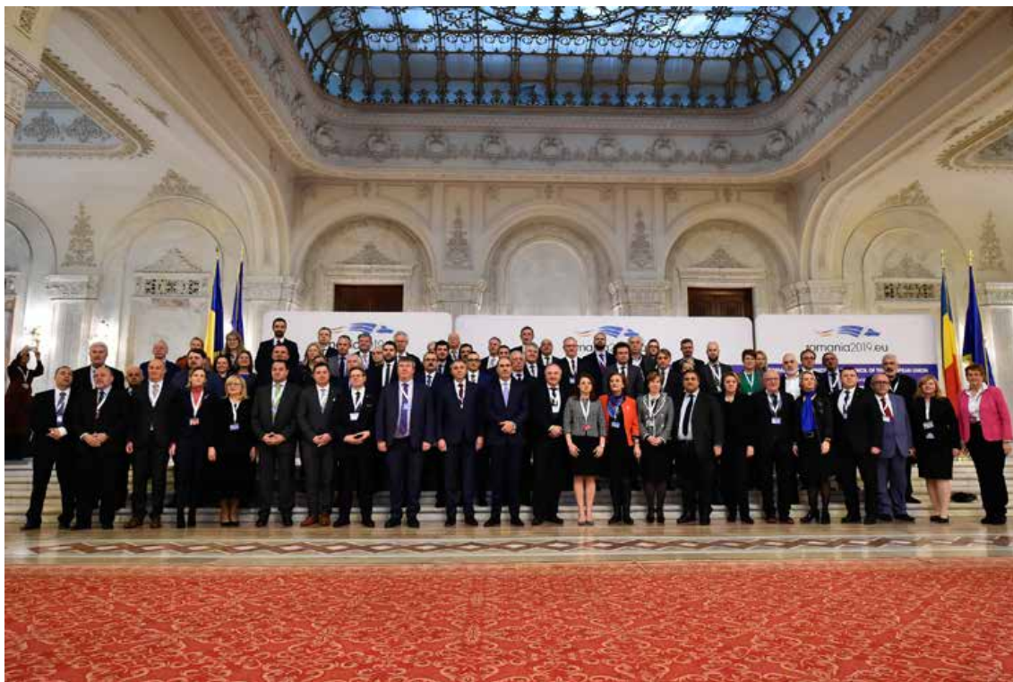
Четвърто заседание на СГПК в Букурещ на 24 и 25 февруари 2019 г.

шестмесечие Европейският парламент и Парламентът на Финландия организираха съвместно петото заседание на СГПК, което се проведе на 23 и 24 септември 2019 г. в сградата на Европейския парламент в Брюксел 11 .