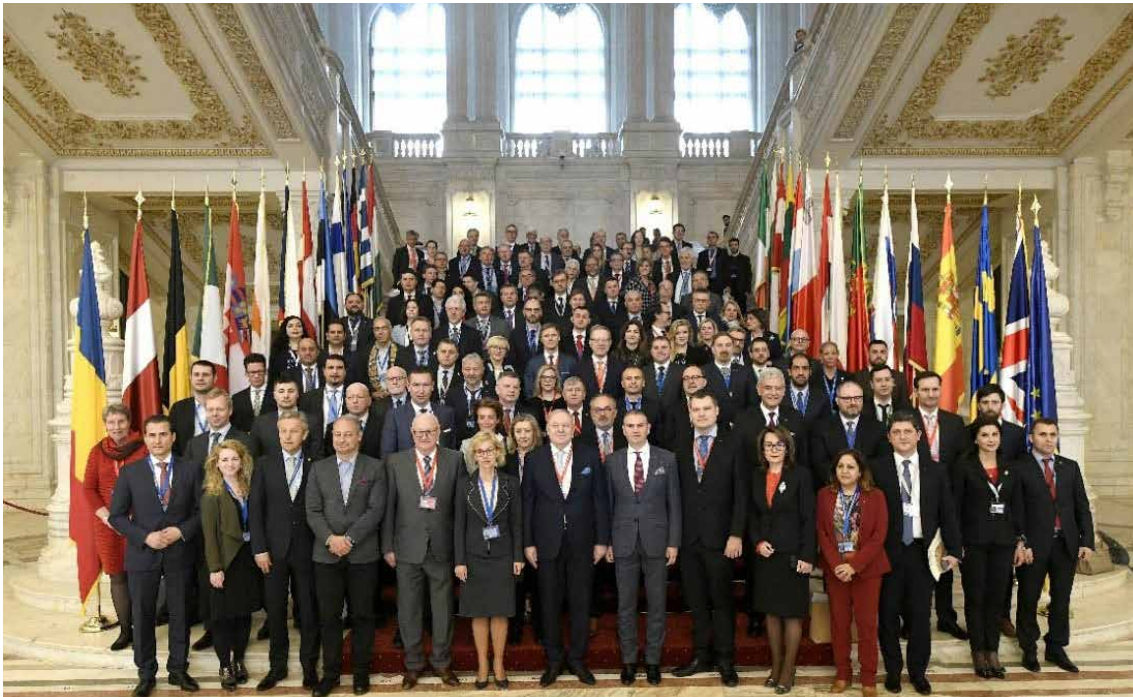
Междупарламентарна конференция по въпросите на общата външна политика и политика на сигурност и общата политика за сигурност и отбрана (МПК ОВППС/ОПСО) в Букурещ, 6 – 8 март 2019 г.

През втората половина на 2019 г. на МПК, проведена в Хелзинки, присъстваха 193 парламентаристи от държавите — членки на ЕС, Европейския парламент, страните — кандидатки за членство в ЕС, и от държавите, поканени като гости. След първата сесия с президента на Финландия г-н Саули Нийнистю, който говори за предизвикателствата пред сигурността в региона на Балтийско море и Арктика, участниците обсъдиха приоритетите на ЕС в областта на ОВППС и ОПСО с г-жа Федерика Могерини, ЗП/ВП, чрез видеоконферентна връзка. Нейните встъпителни думи по актуални и текущи дейности на ЕС в областта на ОВППС и ОПСО бяха последвани от интерактивно обсъждане с членове на Европейския парламент и на националните парламенти. Г-н Карл Билд, бивш министър-председател на Швеция, сподели с участниците размишления относно трансатлантическите отношения. Сред другите обсъдени теми бяха отбраната на ЕС, хибридните заплахи, заплахите за сигурността, свързани с изменението на климата, Иран и Западните Балкани.