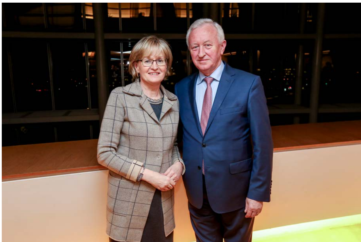
Místopředsedkyně Mairead McGuinness a místopředseda Bogusław Liberadzki

V souladu s Lisabonskou smlouvou byly vnitrostátní parlamenty spolu s Evropským parlamentem pověřeny dohledem nad oblastí spravedlnosti a vnitřních věcí, zejména pokud jde o Europol a Eurojust. Zásadní změnu v meziparlamentní spolupráci představuje činnost skupiny pro společnou parlamentní kontrolu Europolu, která byla zřízena v roce 2017. Jejím hlavním úkolem je monitorovat činnost, kterou Europol vyvíjí při plnění svého poslání, a to v době, kdy úloha Europolu v boji proti terorismu a organizované trestné činnosti nabývá na významu.