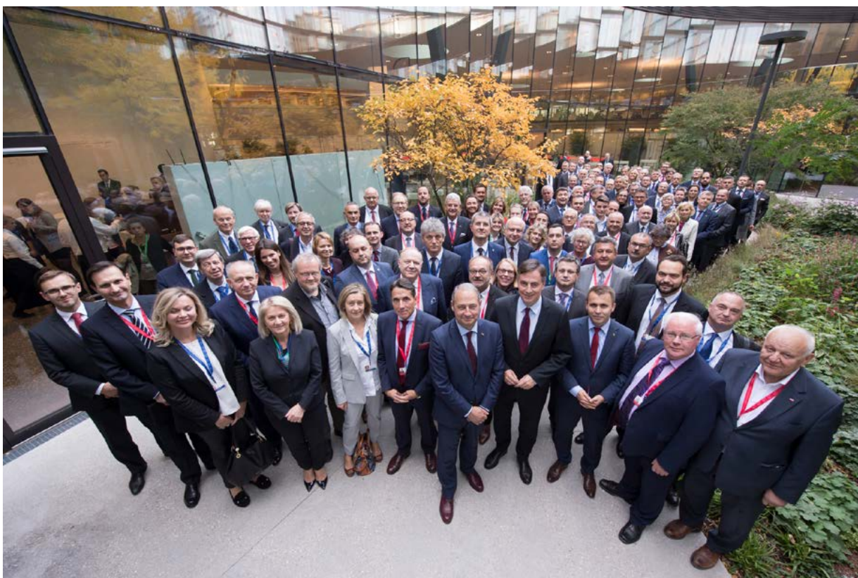
Meziparlamentní konference pro společnou zahraniční a bezpečnostní politiku (SZBP) a společnou bezpečnostní a obrannou politiku (SBOP) ve Vídni, 11.–12. října 2018

V roce 2018 se uskutečnilo 12. a 13. zasedání Meziparlamentní konference pro SZBP/SBOP, a to v Sofii (15.–17. února) a ve Vídni (11.–12. října). Delegace EP se na obě zasedání skládaly z členů Výboru pro zahraniční věci a podvýboru pro bezpečnost a obranu a předsedal jim David McAllister, předseda Výboru pro zahraniční věci.