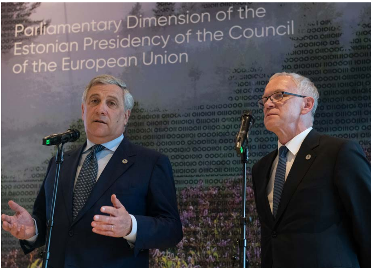
Konferencen af parlamentsformænd i EU i Estland. Antonio Tajani, Europa-Parlamentets formand, mødes med Eiki Nestor, formand for Riigikogu, Estlands parlament

Der var et stort fremmøde af formændene for de nationale parlamenter i EU på det årlige møde i konferencen af parlamentsformænd i EU, som blev afholdt i Tallinn den 23. og 24. april 2018 under forsæde af Eiki Nestor, formand for Riigikogu. Den nyligt valgte formand for Forbundsdagen Wolfgang Schäuble deltog for første gang i konferencen. Europa-Parlamentet var repræsenteret ved formand Antonio Tajani og næstformand Bogusław Liberadzki.