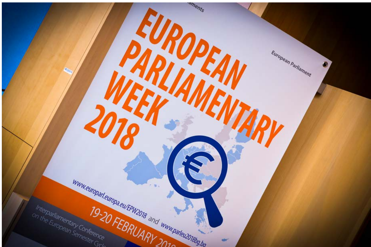
Den europæiske parlamentariske uge fandt sted den 19. og 20. februar 2018 i Bruxelles

Som en halvårlig interparlamentarisk konference inden for rammerne af det østrigske EU-formandskab blev den anden interparlamentariske konference om stabilitet, økonomisk samordning og styring i Den Europæiske Union i 2018 afholdt af det østrigske parlament den 17. og 18. september 2018 i Wien. Drøftelserne på den interparlamentariske konference var koncentreret om følgende fire emner: