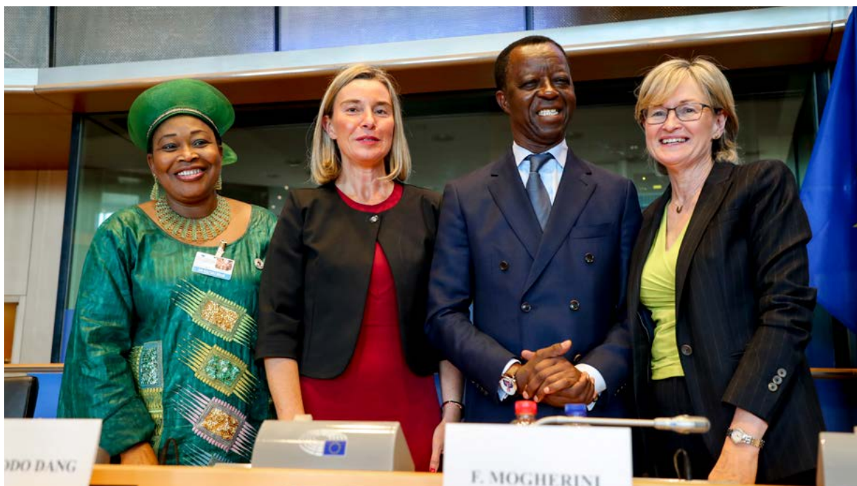
Konferencen på højt plan om fremtiden for international valgobservation: (fra venstre til højre) Cessouma Minata Samate, Den Afrikanske Unions kommissær for politiske anliggender, Federica Mogherini, EU's højtstående repræsentant, formanden for Det Panafrikanske Parlament Roger Nkodo Dang og Europa-Parlamentets næstformand med ansvar for forbindelserne med de nationale parlamenter Mairead McGuinness

Konferencen på højt plan om fremtiden for international valgobservation fandt sted den 10. og 11. oktober 2018 og blev arrangeret i fællesskab af Europa-Parlamentets Gruppe for Demokratistøtte og Valgkoordinering (DEG) og Tjenesten for EU's Optræden Udadtil (EU-Udenrigstjenesten). Omkring 380 deltagere deltog i mødet, herunder 22 medlemmer af de nationale parlamenter i EU og af det schweiziske parlament.