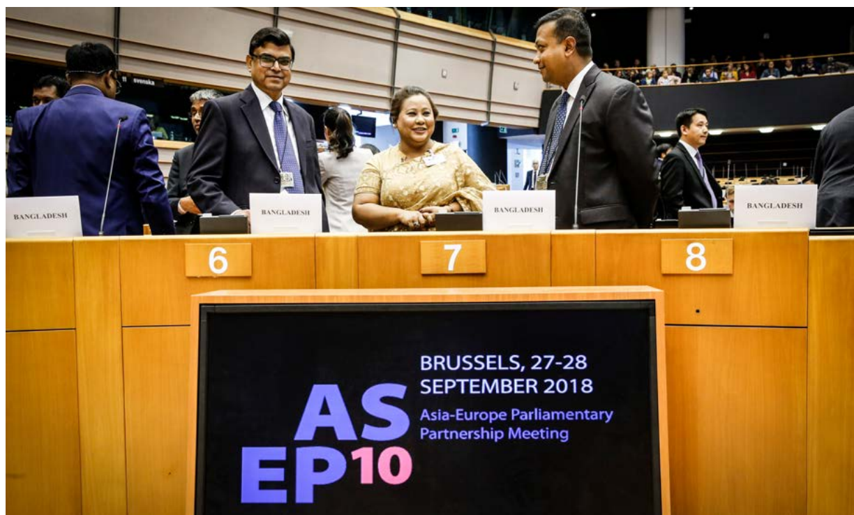
Det 10. møde i det parlamentariske partnerskab mellem Asien og Europa (ASEP 10) den 27. september 2018

Det parlamentariske partnerskab mellem Asien og Europa (ASEP) udgør den parlamentariske dimension af den politiske dialog mellem Asien og EU, som sigter mod at styrke forbindelserne mellem Europa og Asien. Det mest synlige element i denne dialog har traditionelt været Asien-