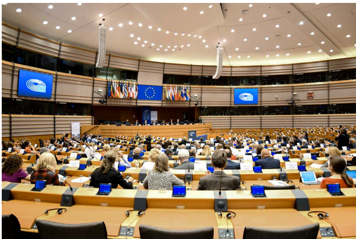
Tredje møde i Gruppen for Fælles Parlamentarisk Kontrol med Europol – præsentation af Gruppen for Fælles Parlamentarisk Kontrol ved formandstrokken 2018-2019.

Gruppen afholder to møder om året: i første halvdel af året i parlamentet i det land, der har det roterende formandskab for Rådet for Den Europæiske Union, og i anden halvdel af året i Europa-Parlamentet.