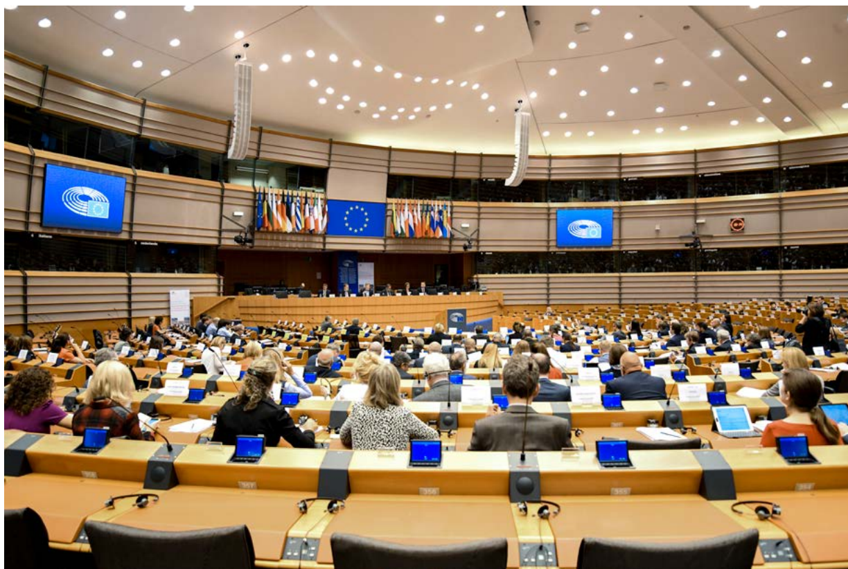
Τρίτη συνεδρίαση της ΜΟΚΕ σχετικά με την Ευρωπόλ- Παρουσίαση των προτεραιοτήτων της ΜΟΚΕ από την Προεδρική Τρόικα 2018-2019

Η ΜΟΚΕ πραγματοποιεί δύο συνεδριάσεις ετησίως: το πρώτο εξάμηνο του έτους, στο κοινοβούλιο της χώρας που ασκεί την εκ περιτροπής προεδρία του Συμβουλίου της ΕΕ και το δεύτερο εξάμηνο του έτους στο Ευρωπαϊκό Κοινοβούλιο.