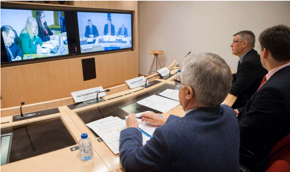
Βιντεοδιάσκεψη στο Ευρωπαϊκό Κοινοβούλιο

επίπεδο κατά τη διάρκεια της επόμενης κοινοβουλευτικής περιόδου του ΕΚ. Τα εθνικά κοινοβούλια της ΕΕ που δεν διαθέτουν συμβατά εργαλεία βιντεοδιάσκεψης θα μπορούσαν να χρησιμοποιούν τις υπηρεσίες των Γραφείων Συνδέσμου του ΕΚ στις εθνικές πρωτεύουσες για τις βιντεοδιασκέψεις με το ΕΚ στις Βρυξέλλες και/ή στο Στρασβούργο.