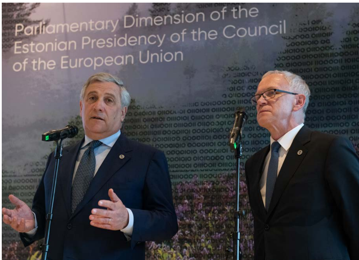
Διάσκεψη των Προέδρων των εθνικών κοινοβουλίων της ΕΕ στην Εσθονία. Ο Antonio Tajani, Πρόεδρος του ΕΚ, συναντά τον Eiki Nestor, Πρόεδρο του Riigikogu, του Κοινοβουλίου της Εσθονίας

Στην ετήσια συνεδρίαση της EUSC που πραγματοποιήθηκε στο Ταλίν στις 23 και στις 24 Απριλίου 2018, υπό την προεδρία του κ. Eiki Nestor, προέδρου του Riigikogu, ήταν υψηλή η συμμετοχή των προέδρων των εθνικών κοινοβουλίων της ΕΕ. Ο πρόσφατα εκλεγμένος Πρόεδρος της Γερμανικής Ομοσπονδιακής Βουλής, κ. Wolfgang Schäuble, έκανε την πρώτη του εμφάνιση στην EUSC. Το Ευρωπαϊκό Κοινοβούλιο εκπροσωπήθηκε από τον Πρόεδρο Tajani και τον Αντιπρόεδρο Bogusław Liberadzki.