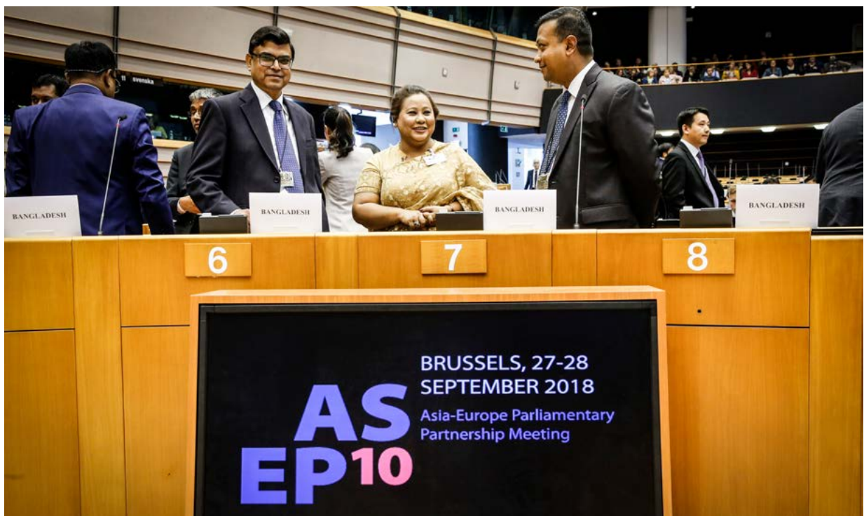
Kymmenes Aasian ja Euroopan parlamentaarisen kumppanuuden kokous (ASEP 10), 27. syyskuuta 2018

Aasian ja Euroopan parlamentaarisen kumppanuuden kokous (ASEP 10) edustaa parlamentaarista ulottuvuutta Aasian ja Euroopan välisessä poliittisessa vuoropuhelussa, jolla pyritään edistämään Euroopan ja Aasian välisiä suhteita. Vuoropuhelun näkyvin ilmentymä on perinteisesti ollut joka toinen vuosi järjestettävä Asia–Eurooppa-kokous (ASEM), hallitustenvälinen huippukokous, joka järjestettiin ensimmäistä kertaa vuonna 1996. ASEPissa annetaan parlamentaarinen panos ja luodaan verkostoja ennen huippukokousta menettelyjen helpottamiseksi. Koska ASEPin yhtenä tavoitteena on vaikuttaa ASEM:n esityslistaan, ASEP järjestetään usein samassa paikassa kuin huippukokous mutta vähän aikaisemmin. Vuonna 2018 järjestetty kymmenes ASEP-kokous (ASEP 10) pidettiin Brysselissä 27. ja 28. syyskuuta. Euroopan parlamentti isännöi sitä ensimmäistä kertaa.