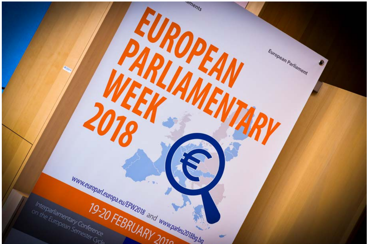
EU:n parlamentaarinen viikko pidettiin Brysselissä 19. ja 20. helmikuuta 2018

työmarkkinavuoropuhelusta vastaava Euroopan komission varapuheenjohtaja Valdis Dombrovskis ja euroryhmän puheenjohtaja Mário Centeno.