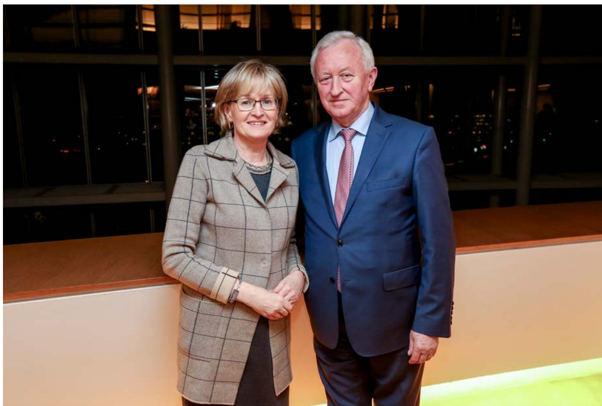
Varapuhemiehet Mairead McGuinness ja Bogusław Liberadzki

Lissabonin sopimuksen mukaisesti kansallisille parlamenteille ja Euroopan parlamentille on annettu oikeus- ja sisäasioiden alalla valvontatehtävä, joka koskee erityisesti Europolia ja Eurojustia. Vuonna 2017 perustetun Europolin yhteisparlamentaarisen valvontaryhmän työ on ollut merkittävä uusi asia parlamenttien välisessä yhteistyössä. Sen päätehtävänä on Europolin toiminnan poliittinen seuranta sen täyttäessä tehtävänsä aikana, jolloin terrorismin ja järjestäytyneen rikollisuuden torjuntaan liittyvästä Europolin roolista on tullut entistä tärkeämpi.