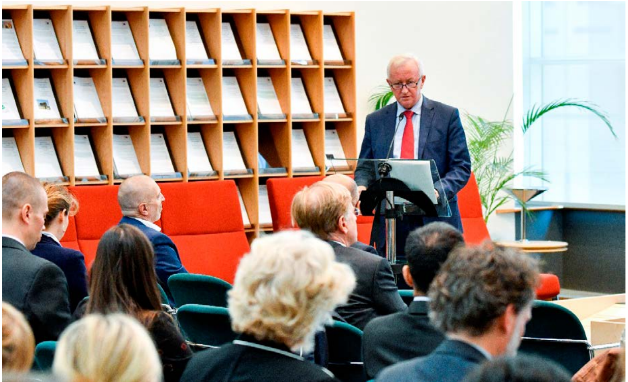
Varapuhemies Bogusław Liberadzki pitämässä puheita syyskuussa järjestetyssä ECPRD-seminaarissa

Tilaisuuteen osallistui 60 edustajaa 28:sta parlamenttien kamarista. Seminaarissa keskityttiin tarkastelemaan palvelujen tarjoamista parlamenttien jäsenille heidän eri rooleissaan: yksilöinä, erikoistuneiden valiokuntien jäseninä ja yhteydenpidon laajentamiseen liittyvässä toiminnassa.