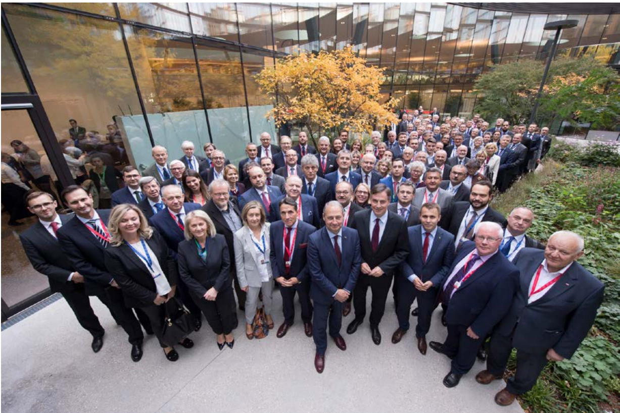
Yhteistä ulko- ja turvallisuuspolitiikkaa (YUTP) ja yhteistä turvallisuus- ja puolustuspolitiikkaa (YTPP) koskeva parlamenttien välinen konferenssi Wienissä 11. ja 12. lokakuuta 2018

Kahdestoista yhteistä ulko- ja turvallisuuspolitiikkaa ja yhteistä turvallisuus- ja puolustuspolitiikkaa koskeva parlamenttien välinen konferenssi järjestettiin Sofiassa (15.17. helmikuuta) ja kolmastoista konferenssi Wienissä (11. ja 12. lokakuuta). Euroopan parlamentin valtuuskunta koostui molemmissa kokouksissa ulkoasiainvaliokunnan sekä turvallisuus- ja puolustuspolitiikan alivaliokunnan jäsenistä, ja valtuuskunnan puheenjohtajana toimi ulkoasiainvaliokunnan puheenjohtaja David McAllister.