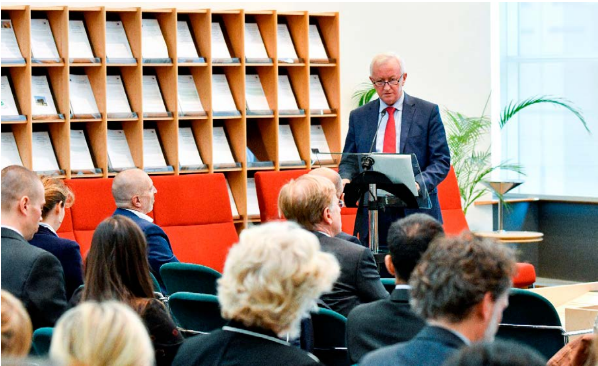
Potpredsjednik Bogusław Liberadzki drži govor na seminaru ECPRD-a u rujnu