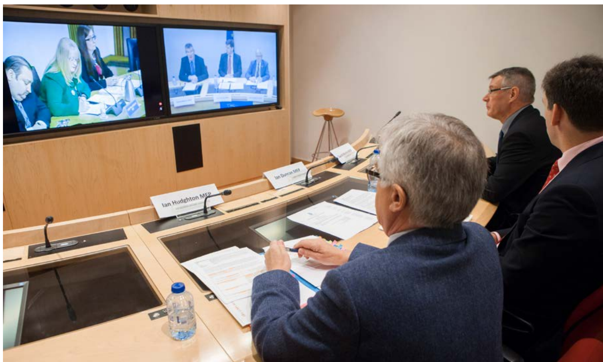
Videokonferencije u Europskom parlamentu

Videokonferencije između nacionalnih parlamenata EU-a i EP-a zastupnicima omogućuju da budu u stalnom kontaktu kada je riječ o određenom pitanju ili da organiziraju rasprave o aktualnim pitanjima kao što je nacrt zakonodavstva. EP je ponudio nacionalnim parlamentima mogućnost pridruživanja jednoj od redovnih međuparlamentarnih sjednica putem videokonferencije, što će učiniti i u budućnosti kada god to bude moguće.