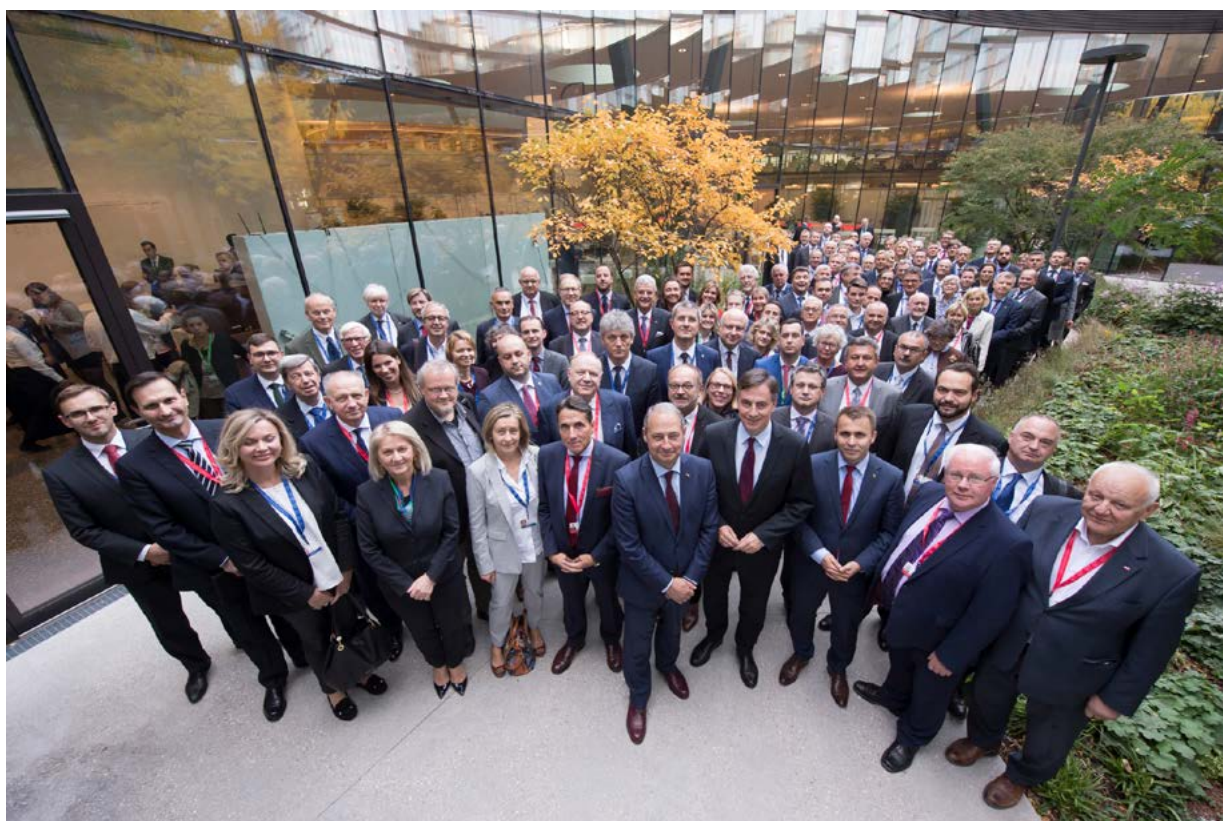
Međuparlamentarna konferencija za zajedničku vanjsku i sigurnosnu politiku te zajedničku sigurnosnu i obrambenu politiku (međuparlamentarna konferencija ZVSP-a/ZSOP-a) u Beču, 11. -12. listopada 2018

2018. godine održane su 12. i 13. međuparlamentarna konferencija ZVSP-a/ZSOP-a i to u Sofiji (od 15. do 17. veljače) i u Beču (od 11. do 12. listopada). Izaslanstva Europskog parlamenta na obje konferencije činili su članovi Odbora za vanjske poslove i Pododbora za sigurnost i obranu, a predsjedao im je predsjednik Odbora za vanjske poslove David McAllister.