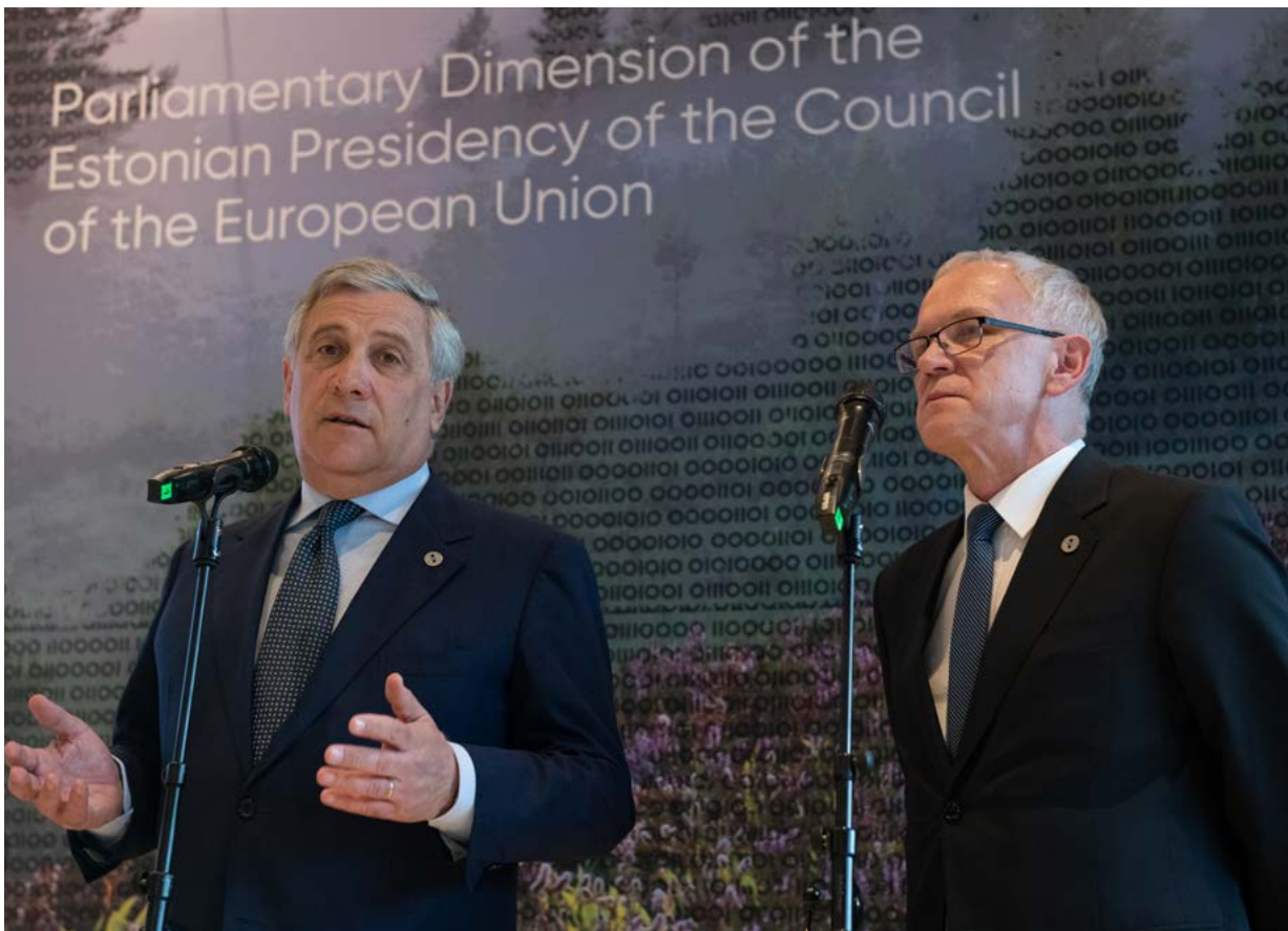
Konferencija predsjednika parlamenata Europske unije u Estoniji. Predsjednik Europskog parlamenta Antonio Tajani s Eikijem Nestorom, predsjednikom estonskog Parlamenta

Predsjednici nacionalnih parlamenata EU-a u velikom su broju prisustvovali sastanku u Tallinnu održanom 23. i 24. travnja 2018. kojem je predsjedao Eiki Nestor, predsjednik estonskog Parlamenta (Riigikogu). To je bilo i prvo službeno pojavljivanje nedavno izabranog predsjednika Bundestaga Wolfganga Schäublea. Europski parlament zastupali su predsjednik Antonio Tajani i potpredsjednik Bogusław Liberadzki.