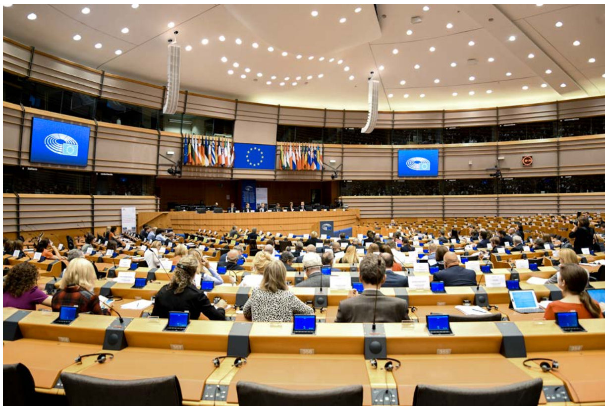
Treći sastanak Zajedničke skupine za parlamentarni nadzor Europol – predstavljanje prioriteta JPSG-a koje predstavlja predsjednička trojka za razdoblje 2018. – 2019

JPSG održava dvije sjednice godišnje: u prvoj polovici godine u parlamentu države koja predsjedava rotirajućim predsjedništvom Vijeća EU-a, a u drugoj polovici godine u Europskom parlamentu.