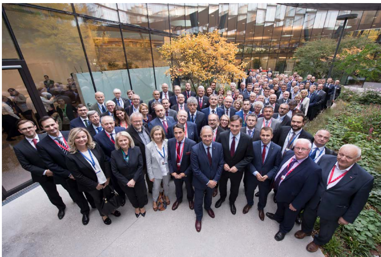
Tarpparlamentinė konferencija bendros užsienio ir saugumo politikos ir bendros saugumo ir gynybos politikos klausimais (TPK BUSP(BSGP)) Vienoje, 2018 m. spalio 12–11 d.

2018 m. 12-oji ir 13-oji tarpparlamentinės konferencijos BUSP ir BSGP klausimais vyko Sofijoje (vasario 15-17 d.) ir Vienoje (spalio 11-12 d.). EP delegaciją abiejose konferencijose sudarė Užsienio reikalų komiteto bei Saugumo ir gynybos pakomitečio nariai; delegacijoms vadovavo Užsienio reikalų komiteto pirmininkas David McAllister.