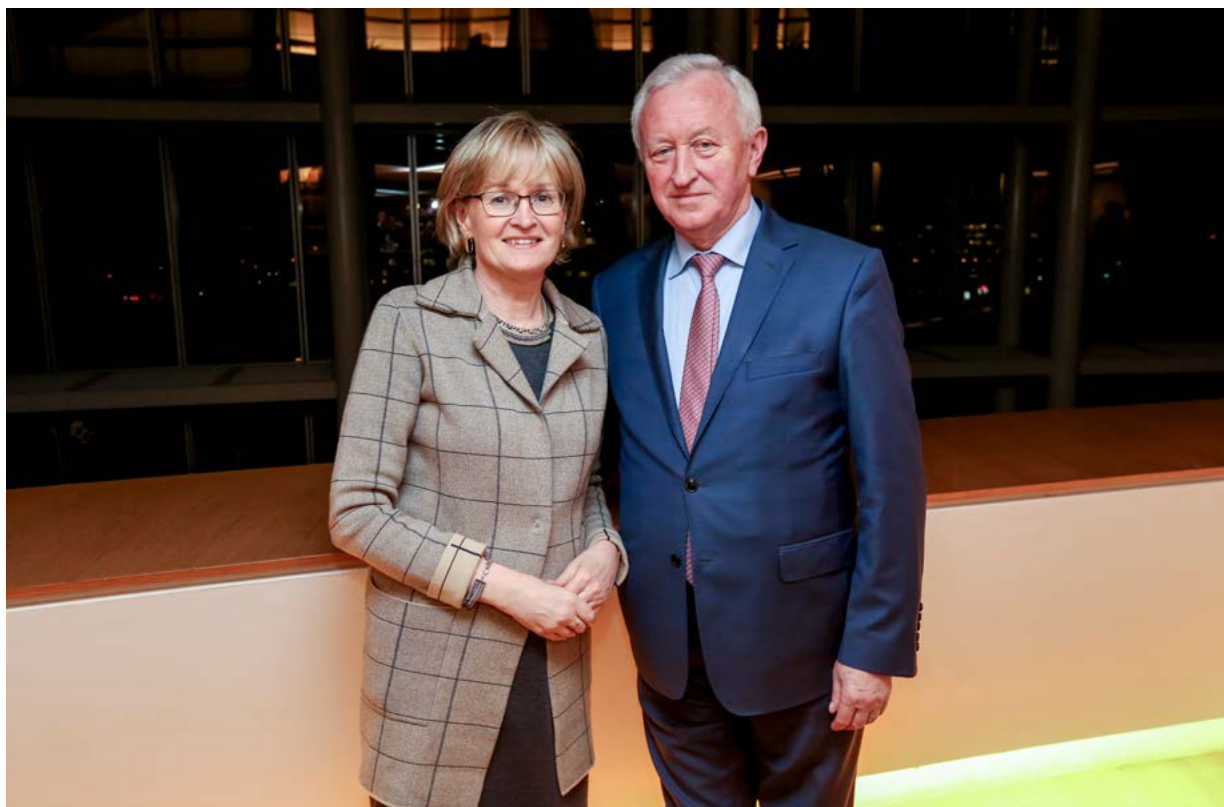
Pirmininko pavaduotojai Mairead McGuinness ir Bogusław Liberadzki

Bendrame politiniame kontekste, kuriame valstybėms narėms didžiąją susirūpinimą tebekelia tarpvalstybinio saugumo ir saugos problemos, įskaitant prekybą žmonėmis, su narkotikais susijusius nusikaltimus, terorizmą ir kibernetinius išpuolius, Europolo vaidmuo kovojant su terorizmu ir organizuotu nusikalstamumu tampa vis svarbesnis. Kaip numatyta Lisabonos sutartyje, Europolo veiklą dabar kontroliuoja nacionaliniai parlamentai ir Europos Parlamentas. 2017 m. įsteigta Jungtinė parlamentinės kontrolės grupė dėl Europolo 2018 m. posėdžiavo du kartus. Jos pagrindinė užduotis – politinė Europolo veiklos jam vykdant savo misiją stebėseną.