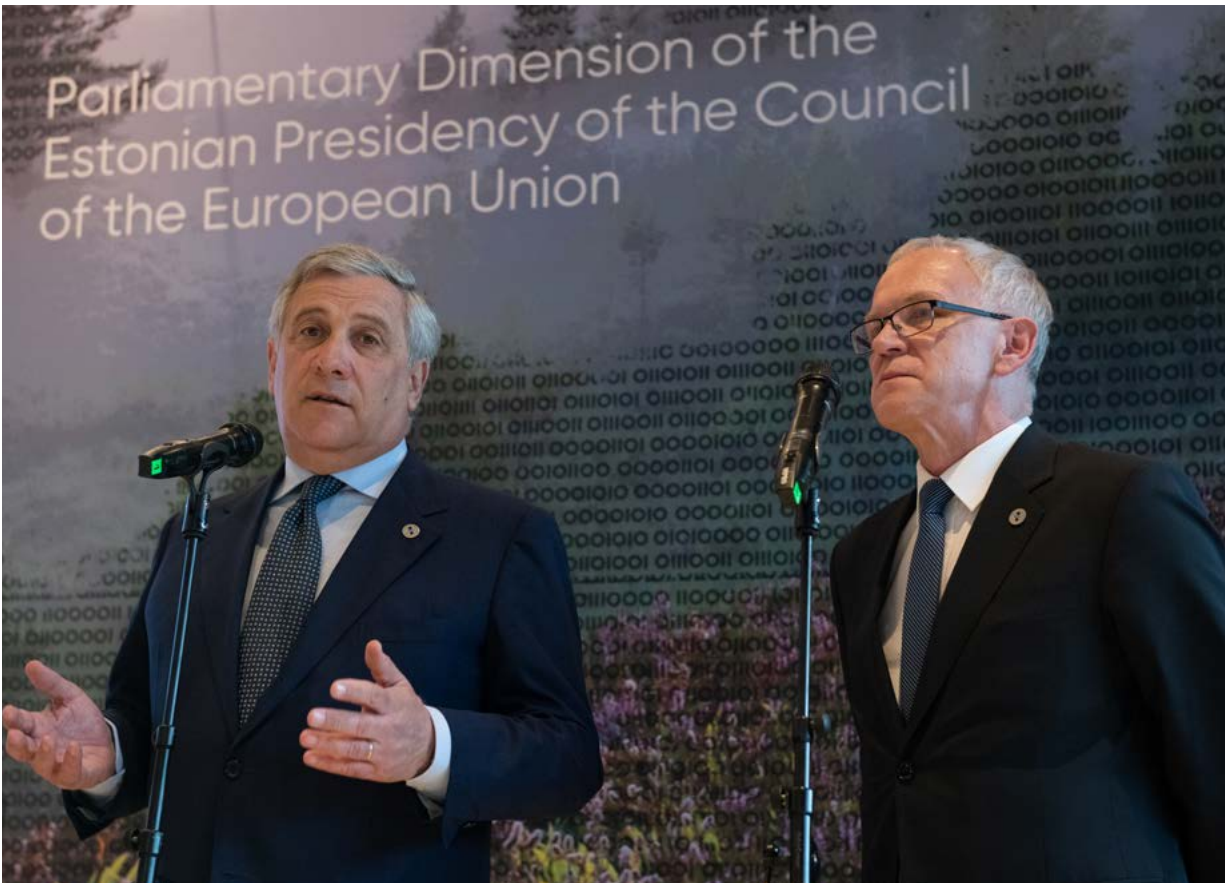
ES parlamentų pirmininkų konferencija Estijoje. EP Pirmininkas Antonio Tajani susitinka su Estijos parlamento (Riigikogu) pirmininku Eiki Nestor