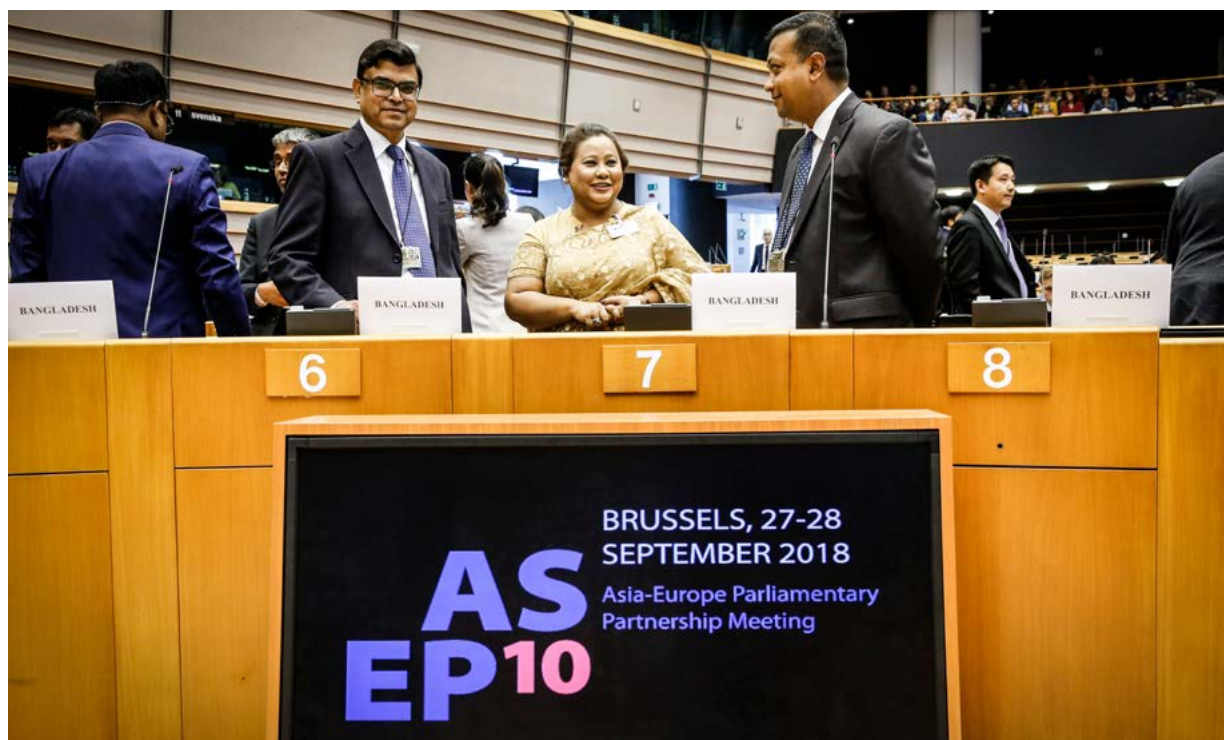
2018 m. rugsėjo 27 d. 10-asis Azijos ir Europos parlamentinės partnerystės (ASEP) susitikimas

Azijos ir Europos parlamentinė partnerystė (ASEP) – Azijos ir Europos politinio dialogo parlamentinis lygmuo, kuriuo siekiama stiprinti Europos ir Azijos santykius. Geriausiai žinomas šio dialogo aspektas – kas dvejus metus rengiamas Azijos ir Europos susitikimas (ASEM); šis tarpvyriausybiniis aukščiausiojo lygio susitikimas pirmą kartą buvo surengtas 1996 metais. ASEP prisideda parlamentų indėliu ir plėtoja tinklus prieš rengiant aukščiausiojo lygio susitikimą, kad būtų sudarytos palankios sąlygos jam vykti. Kadangi vienas iš ASEP tikslų yra daryti įtaką ASEM darbotarkei, ASEP paprastai vyksta toje pačioje vietoje kaip ir aukščiausiojo lygio susitikimas, tačiau šiek tiek anksčiau. 2018 m. rugsėjo 27–28 d. Briuselyje vyko 10-asis Azijos ir Europos parlamentinės partnerystės (ASEP) susitikimas. Pirmą kartą jis vyko Europos Parlamente.